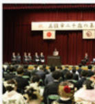
五條市二十歳の集い