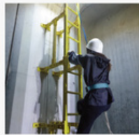
田原本町社協駐車場他雨水貯水施設の視察