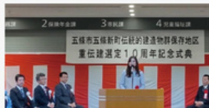
五條市町重伝建選定10周年記念式典