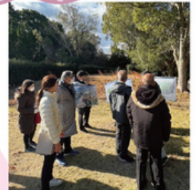
総合防災対策特別委員会 旧ブレディアゴルフ場視察