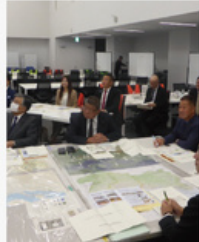
建設委員会県外視察 ◎熊本県防災センター