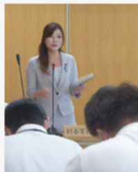
総合防災対策特別委員会