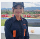
五條市総合防災訓練