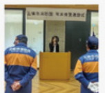
五條市消防団 年末夜警激励式