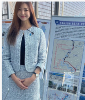
奈良県の道路と都市公園整備の充実を求める合同県民大会