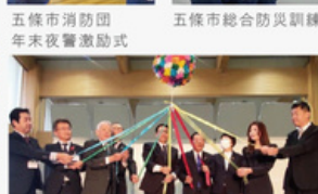
五條市文化祭開会式典