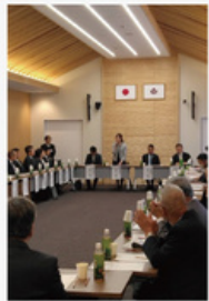
奈良県議会南部振興議員連盟 懇談会 地域の皆様との防災訓練