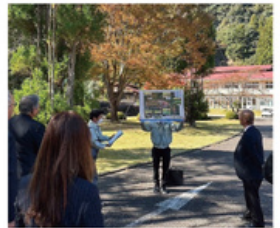
総合防災対策特別委員会 既存の広域防災拠点を視察