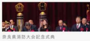
奈良県消防大会記念式典