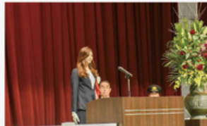
令和6年五條市消防出初式