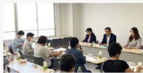
医療会・看護連盟歯科医師会・建設支部との意見交換