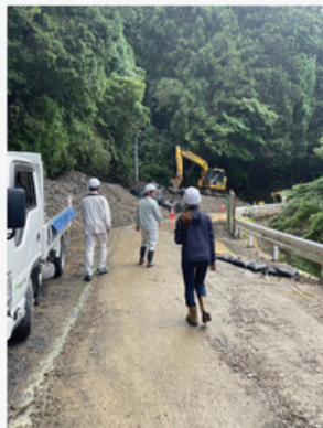
災害現場対応を実施