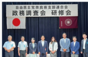
自由民主党政務調査会研修会